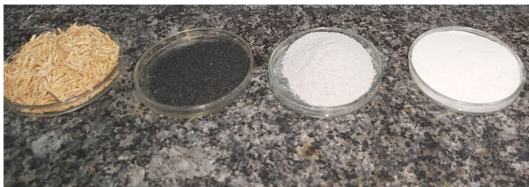
شکل ۲ تصاویر از چپ به راست: شلتوک برنج، خاکستر شلتوک برنج، سیلیکای تولیدشده به روش عملیات گرمایی و سیلیکای تولیدشده به روش عملیات اسیدی/گرمایی

Figure 2 from left: rice husk, husk ash, silica from thermal treatment, silica from acid/thermal treatment